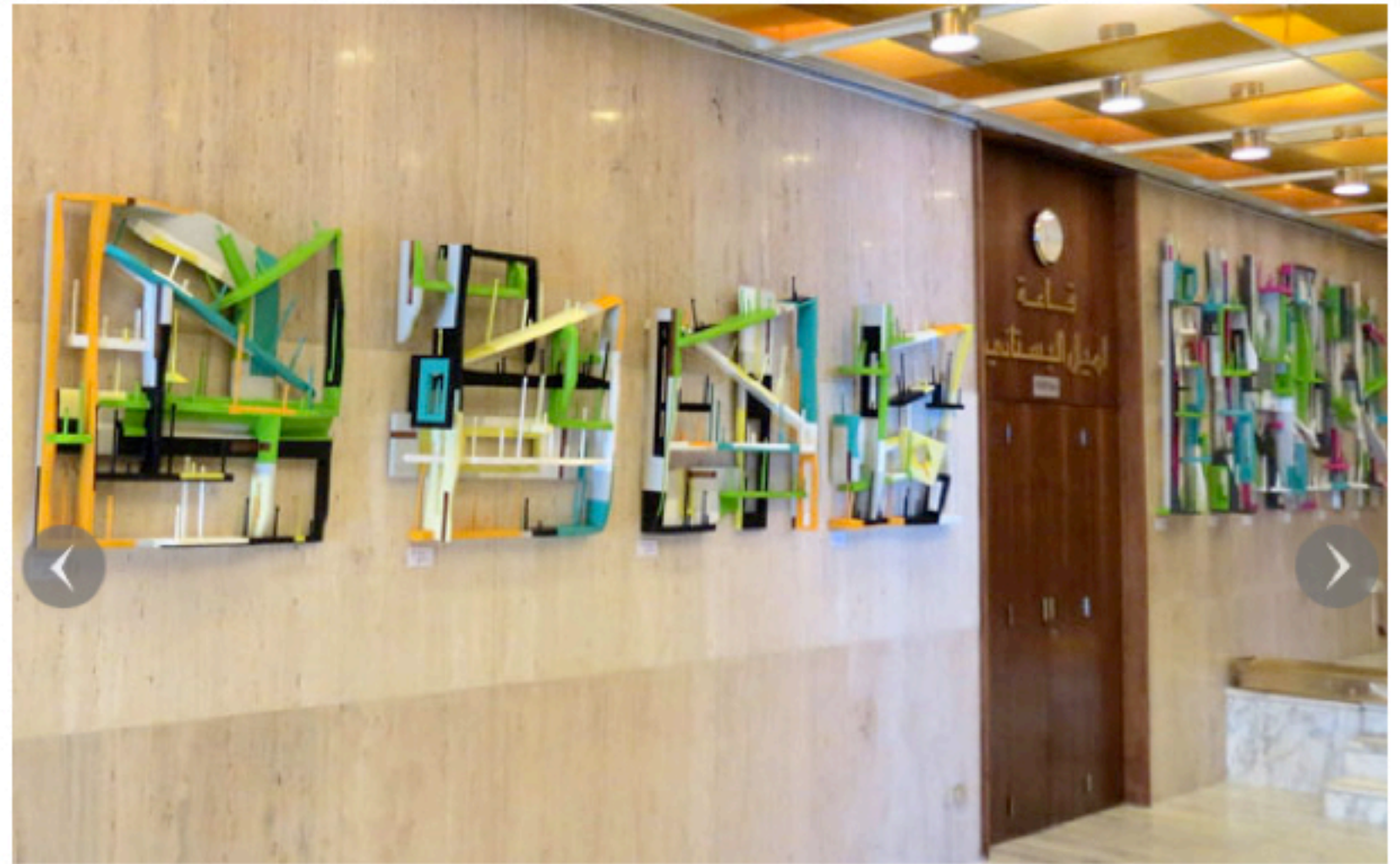
"Odditorium" في مهرجان البستان الدولي من توقيع نبيل الحلو