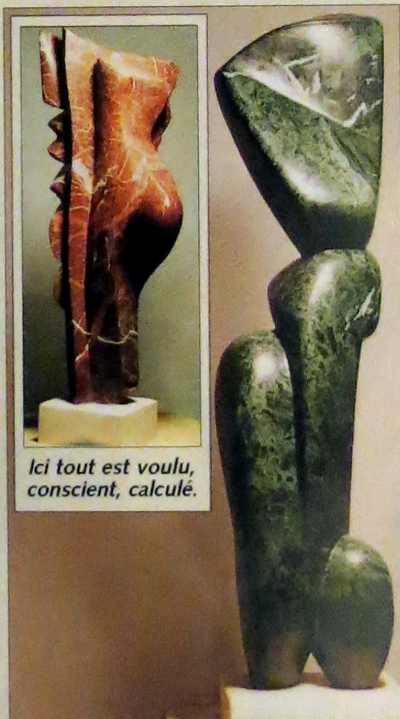
Ici tout est voulu, conscient, calculé.