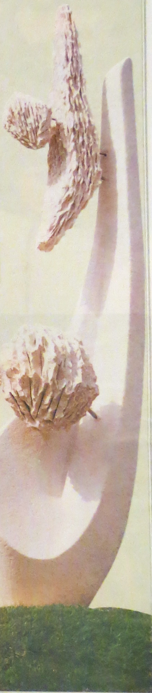
Formes et volumes libérés de toute soumission au réel.