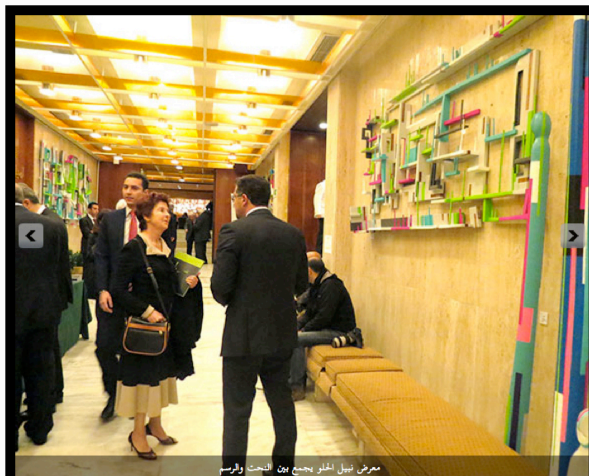
معرض نبيل الحلو يجمع بين النحت والرسم